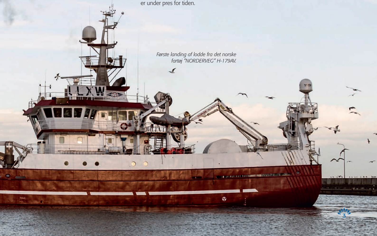
Første landing af lodde fra det norske fartøj "NORDERVEG" H-179AV.

Dertil kommer, at den kommende høst af soja i Brasilien og Argentina kan påvirke prisdannelsen af soja med afsmittende virkning på prisen for fiskemel og fiskeolie.