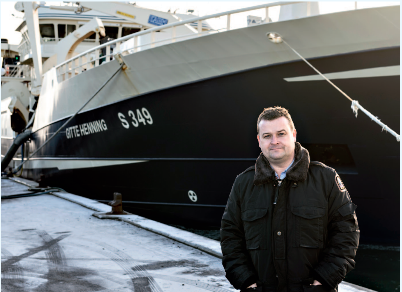
På kajen i Skagen: - Et godt samarbejde mellem salgsafdeling, kaj og fabrik er en afgørende faktor for effektivitet og fleksibilitet.