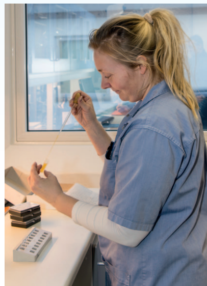
Den nyuddannede laborant i færd med en del af den metode der betyder, at 4-5 timers arbejde med at bestemme fedtsyreprofilens sammensætning i fiskeolier kan reduceres til 30 sekunder.

Formelt hed projektet "Udvikling og kalibrering af metode til bestemmelse af fedtsyre i fiskeolie med "Near Infrared Analyzer".