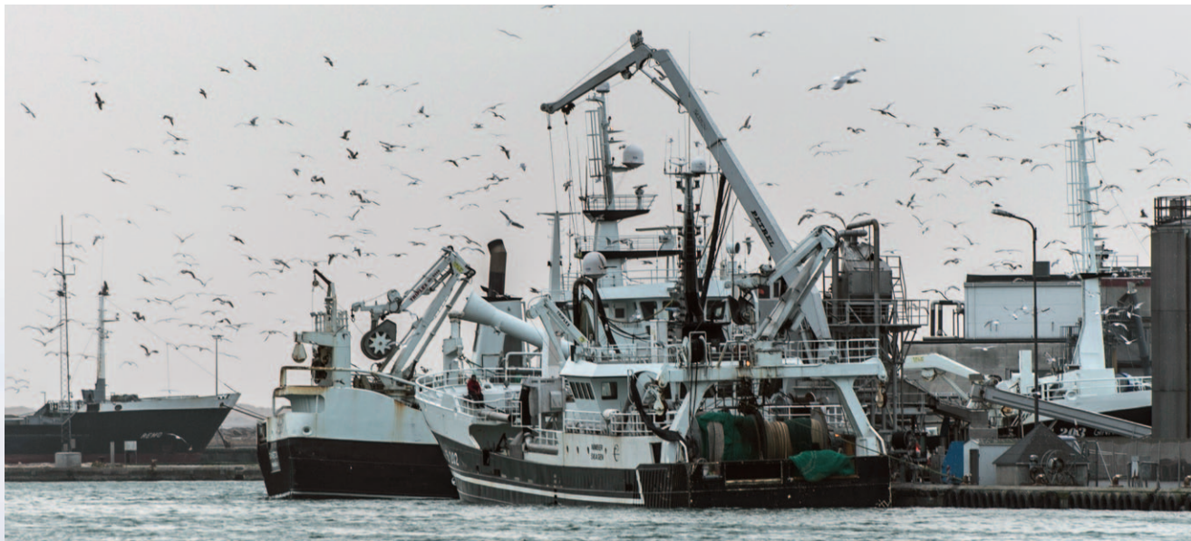
S 202 "Nimber" lander brisling fra Østersøen i januar. Foran stævnen ses GG 203 "Ginneton".