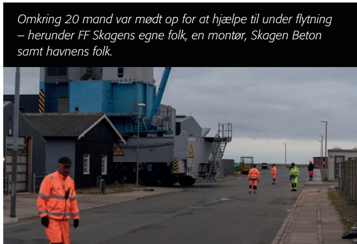
Omkring 20 mand var mødt op for at hjælpe til under flytning – herunder FF Skagens egne folk, en montør, Skagen Beton samt havnens folk.