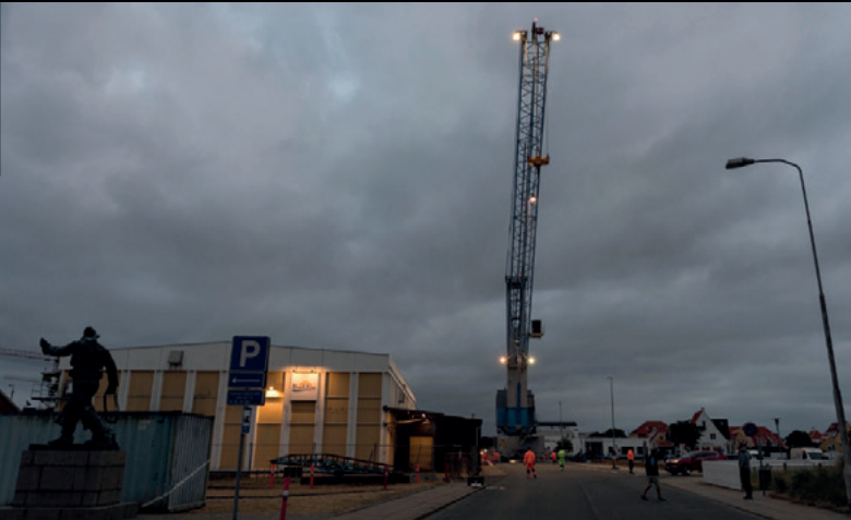
Ruten gennem byen var 3,5 km lang og gik blandt andet forbi gågaden, rådhuspladsen og et hotel.