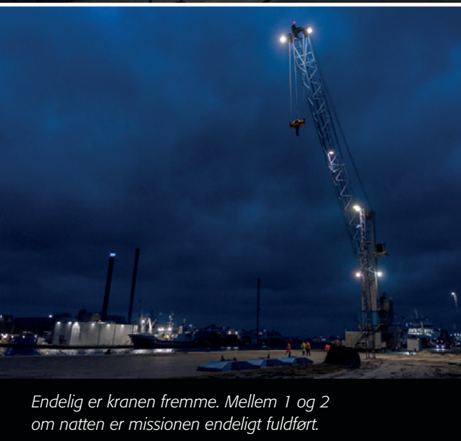
Endelig er kranen fremme. Mellem 1 og 2 om natten er missionen endeligt fuldført.