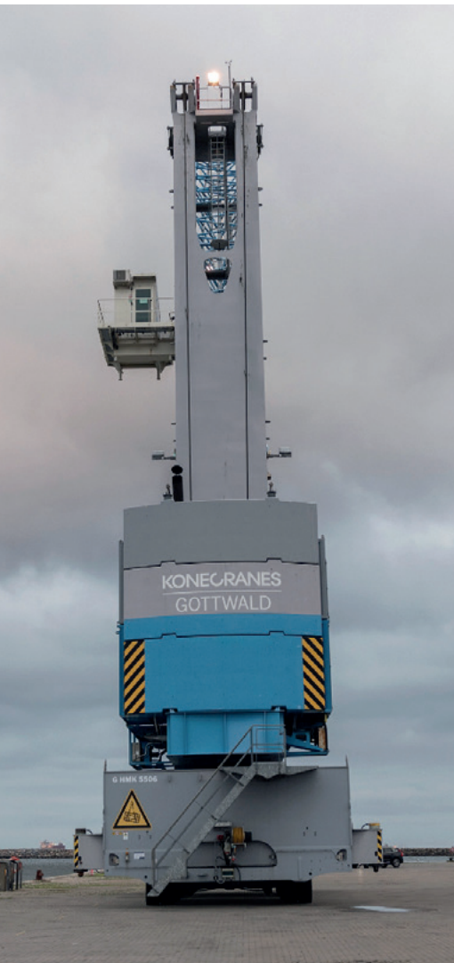
Det var denne kran, der skulle flyttes en midsommeraften kl. 22. Kranen er 60 meter høj og vejer 380 ton.

I midsommernattens skær mødte der turisterne i Skagen et sjældent syn: Gennem midten af byen kom en 380 ton tung og 60 meter høj kran kørende. Det skete i forbindelse med, at FF Koncernens stevedorevirksomhed flyttede adresse til det nye havneareal.